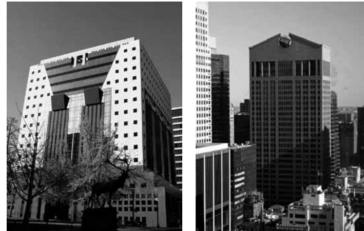
Portland Building ที่เมือง Portland รัฐ Oregon (1982) โดย Michael Graves (ซ้าย) และ AT&T Building, New York (1984) โดย Philip Johnson

จะว่าไป ภาพที่ว่ามันก็อาจไม่ได้ผิดเสียเลยทีเดียว แต่มันก็ไม่ใช่ความหมายเต็มๆ ของโปสท์โมเดิร์นที่เราจะพูดถึงกันวันนี้ เพราะภาพดังกล่าวเป็นเพียงความหมายเชิงรูปแบบสถาปัตยกรรม (architectural style) รูปแบบหนึ่ง ที่สะท้อนกระบวนการความคิดอย่างโปสท์โมเดิร์นเท่านั้น ซึ่งตรงกับแนวทางที่ชาร์ลส์ เจนคส์ เคยเรียกไว้ในหนังสือของเขาว่าโปสท์โมเดิร์นแบบพหุนิยม (postmodern pluralism) และประวัติศาสตร์นิยม (postmodern historicism) 3